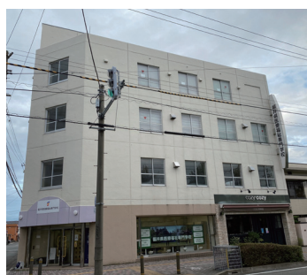
福井県医療福祉専門学校 Fukui Medical Welfare College