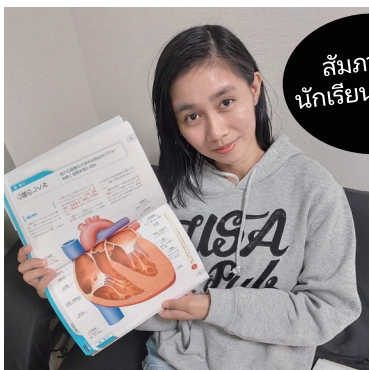
สัมภาษณ์นักเรียนปัจจุบัน

ทางวิทยาลัยจะสนับสนุนการเดินทางเรื่องต่างๆ เกี่ยวกับสถานภาพการพำนัก การศึกษาต่อ การหางานทำ ฯลฯ อย่างเต็มที่!